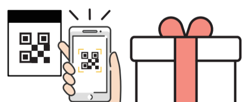
※QRコードは株式会社デンソーウェーブの登録商標です。

会場のQRコードを 読み取りスタンプをゲット! スタンプを集めて プレゼントに応募!