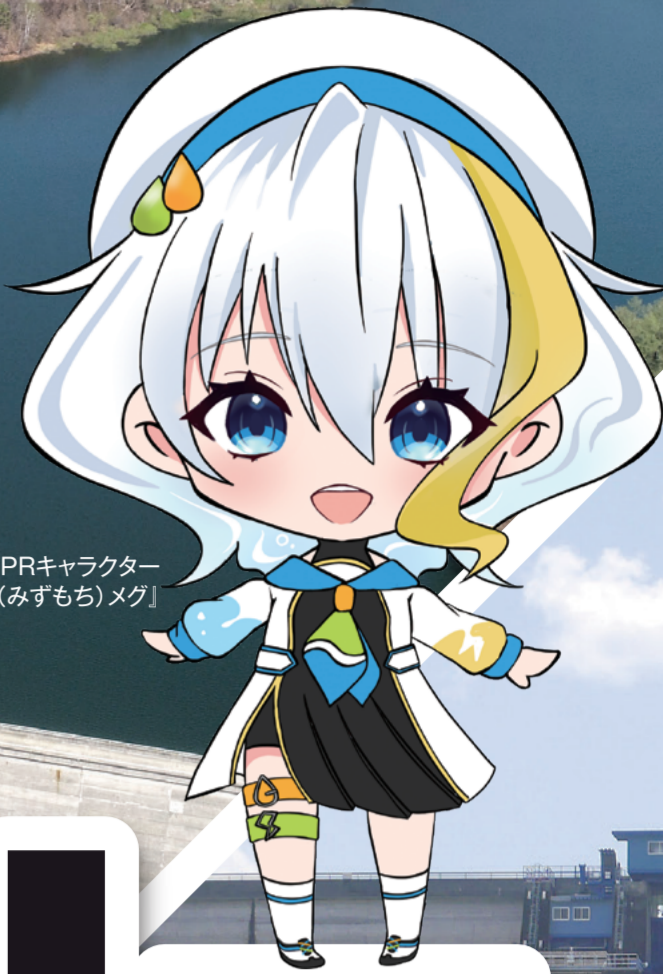
長野県企業局PRキャラクター「水望(みずもち)メグ」