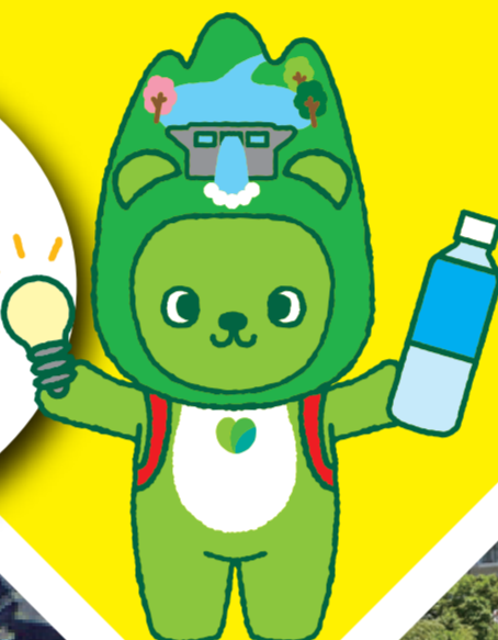
長野県PRキャラクター「アルクム」(ダムバージョン)