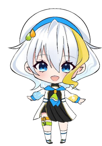
長野県企業局PRキャラクター「水望(みずもち)めぐ」